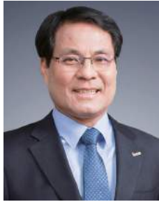
한남대학교 총장 이 덕 훈

한남대학교는 2014년 교육부 지방대학특성화사업(CK-1)에 선정 되어 융복합과 국제화 교육의 질적 우수성을 기반으로 지역사회 및 산업체에 기여하고자 최선을 다하고 있습니다.